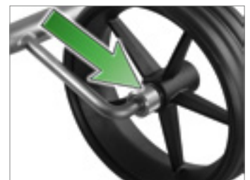
Lösen und Befestigen der Räder