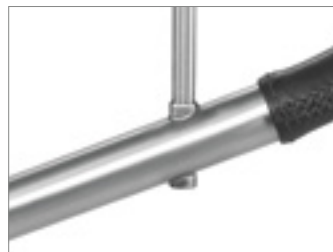
Schirmadapter mit TiCad Schirmhalter

Der Schirmadapter befindet sich am oberen Ende der Deichsel. Der Schirmhalter wird in den konisch zulaufenden Adapter eingeschraubt. Dieser kann nur in der Standardposition der Deichsel verwendet werden.