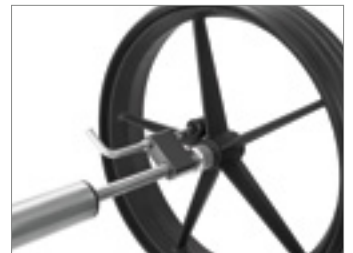
Feststellbremse im gesetzten Zustand