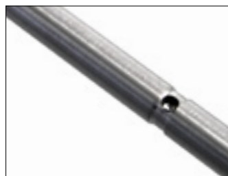
Achse mit Rastbolzennut und Arretierung

Das Eindringen von Schmutz in die Nabe sollte vermieden werden. Die Naben dürfen nicht geölt oder gefettet werden.