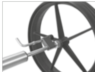
Feststellbremse im gelösten Zustand

Die Feststellbremse muss am linken Rad sitzen. Zum Lösen und Setzen der Bremse wird der Sperrriegel entsprechend zurückgeschoben oder arretiert.