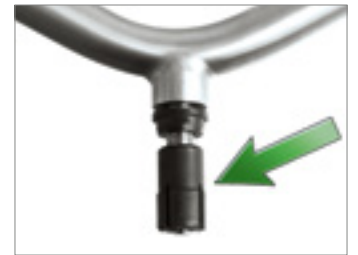
Spreizdübel in richtiger Position