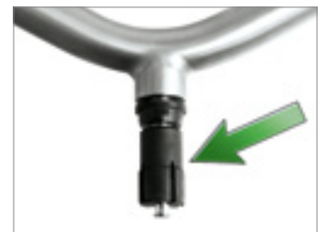
Spreizdübel zu weit eingedreht